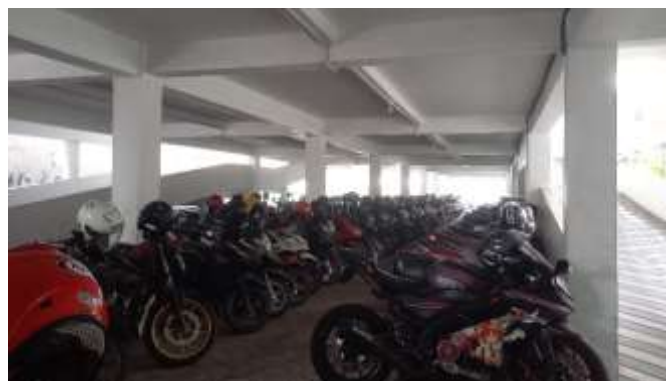
Gambar 5. Parkiran Motor Sekolah SMA Antartika Sidoarjo

Pada gambar 3.1.1 memberikan pemandangan lingkungan sekolah yang bersih, asri, dan nyaman. SMA Antartika Sidoarjo membiasakan warga sekolahnya untuk selalu menjaga kebersihan lingkungan area sekolah untuk menciptakan tempat belajar mengajar yang nyaman. Kebiasaan ini juga dapat disebut sebagai budaya sekolah dalam kebersihan lingkungan sekolah. Cara ini sungguh efektif dilakukan pada sekolah yang membangun wawasan Wiyata Mandala, yang artinya pentingnya sekolah sebagai tempat tidak hanya untuk belajar ilmu pengetahuan, tetapi juga untuk membentuk karakter dan moral siswa. Sekolah diharapkan menjadi komunitas belajar yang saling mendukung, di mana siswa, guru, dan orang tua bekerja sama untuk mencapai tujuan pendidikan. Maka sangat penting untuk menjaga kebersihan lingkungan sekolah guna mencapai tujuan pembelajaran yang kondusif dan inovatif.