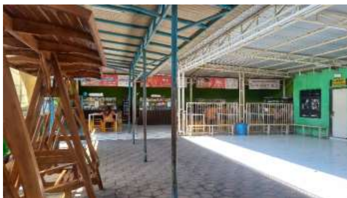
Gambar 6. Kantin Gedung B SMA Antartika Sidoarjo

Kebersihan lingkungan kantin di sekolah sangat penting untuk mendukung kesehatan dan kenyamanan siswa. Kantin yang bersih tidak hanya menciptakan suasana yang menyenangkan bagi para siswa saat makan, tetapi juga mencegah penyebaran penyakit yang dapat disebabkan oleh makanan yang terkontaminasi atau lingkungan yang kotor. Dengan menjaga kebersihan, seperti rutin membersihkan meja, lantai, dan peralatan makan, sekolah dapat memastikan bahwa makanan yang disajikan aman untuk dikonsumsi. Selain itu, kebersihan kantin juga mencerminkan nilai-nilai disiplin dan tanggung jawab yang ingin ditanamkan kepada siswa.