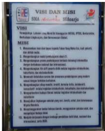
Gambar 2. Visi dan misi SMA Antartika Sidoarjo

Visi: Terwujudnya Lulusan yang Memiliki Keunggulan IMTAQ, IPTEK, Berkarakter, Berbudaya Lingkungan, dan Berwawasan Global.