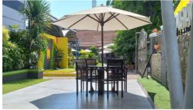
Gambar 4. Lingkungan Sekolah SMA Antartika Sidoarjo

Pada gambar 3.1.1 memberikan pemandangan lingkungan sekolah yang bersih, asri, dan nyaman. SMA Antartika Sidoarjo membiasakan warga sekolahnya untuk selalu menjaga kebersihan lingkungan area sekolah untuk menciptakan tempat belajar mengajar yang nyaman. Kebiasaan ini juga dapat disebut sebagai budaya sekolah dalam kebersihan lingkungan sekolah. Cara ini sungguh efektif dilakukan pada sekolah yang membangun wawasan Wiyata Mandala, yang artinya pentingnya sekolah sebagai tempat tidak hanya untuk belajar ilmu pengetahuan, tetapi juga untuk membentuk karakter dan moral siswa. Sekolah diharapkan menjadi komunitas belajar yang saling mendukung, di mana siswa, guru, dan orang tua bekerja sama untuk mencapai tujuan pendidikan. Maka sangat penting untuk menjaga kebersihan lingkungan sekolah guna mencapai tujuan pembelajaran yang kondusif dan inovatif.