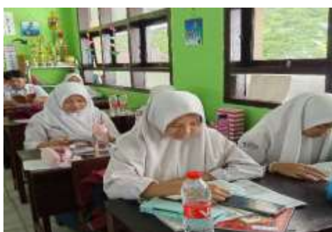
Gambar 7. Siswa Siswi Membaca Yasin Bersama

Penanaman iman dan taqwa kepada Tuhan Yang Maha Esa merupakan fondasi utama dalam kehidupan spiritual setiap individu. Iman adalah keyakinan yang mendalam terhadap keberadaan Tuhan, sementara taqwa adalah sikap hati-hati dan kesadaran untuk selalu menjalankan perintah-Nya serta menjauhi larangan-Nya. Dalam konteks kehidupan sehari-hari, penanaman iman dan taqwa tidak hanya berfungsi sebagai pedoman moral, tetapi juga sebagai sumber ketenangan jiwa dan kekuatan dalam menghadapi berbagai tantangan. Untuk menanamkan iman dan taqwa, berbagai metode dapat diterapkan, baik di lingkungan keluarga, sekolah, maupun masyarakat. SMA Antartika Sidoarjo telah menerapkan beberapa metode dalam penanaman iman dan taqwa kepada Tuhan, sebagai berikut.