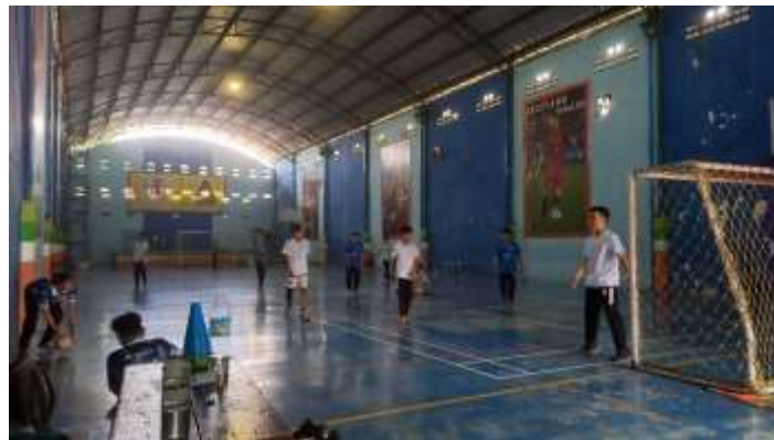
Gambar 8. Kegiatan Ekstrakurikuler Futsal SMA Antartika Sidoarjo

Kegiatan ekstrakurikuler di sekolah memiliki pengaruh yang signifikan terhadap perkembangan life skills peserta didik. Penelitian menunjukkan bahwa semakin baik pelaksanaan kegiatan ekstrakurikuler, semakin baik pula keterampilan hidup yang dimiliki siswa, seperti kemampuan berkomunikasi, bekerja sama, dan memimpin. Kegiatan ini tidak hanya memberikan kesempatan bagi siswa untuk mengembangkan minat dan bakat mereka, tetapi juga membantu mereka belajar bagaimana berinteraksi dengan orang lain secara efektif. Melalui berbagai aktivitas, siswa dilatih untuk menghadapi tantangan dan memecahkan masalah, yang merupakan bagian penting dari life skills yang diperlukan dalam kehidupan sehari-hari.