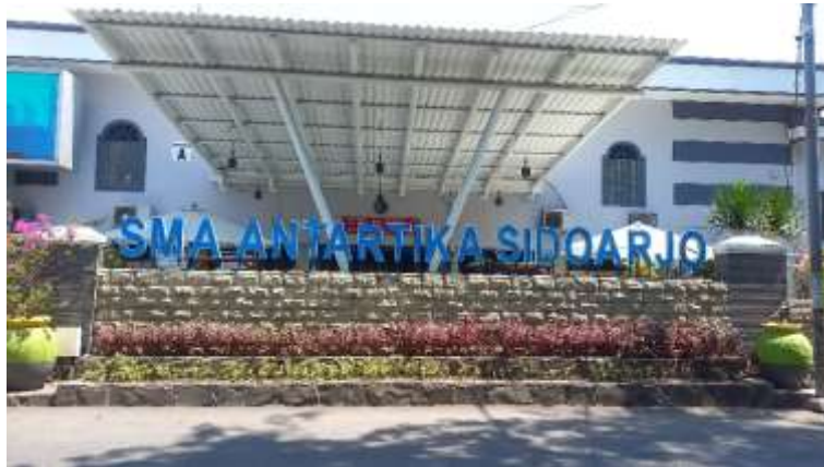
Gambar 1. SMA Antartika Sidoarjo

Objek untuk melakukan observasi penelitian ini bertempat pada SMA Antartika Sidoarjo yang beralamat lengkap Jl. Raya Siwalanpanji No.6, Siwalanpanji, Buduran, Kabupaten Sidoarjo, Jawa Timur 61252. SMA Antartika Sidoarjo merupakan sekolah swasta terfavorit di kabupaten Sidoarjo. Alasan pemilihan SMA Antartika Sidoarjo sebagai tempat objek penelitian adalah karena sekolah swasta ini memiliki berbagai macam kebudayaan yang menarik dan telah dilakukan secara rutin setiap waktunya.