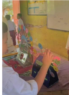
Gambar 1 dan 2. Siswa mencoba media roda putar huruf