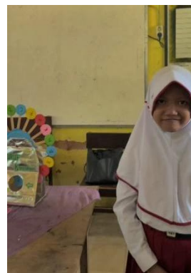
Gambar 3 dan 4. Siswa menulis dan menyebutkan kata dari huruf awalan hasil media yang di putar

Pada penggunaan media roda putar huruf pada siswa kelas 2 memang menghadirkan pembelajaran yang interaktif serta menyenangkan, namun hal demikian tidak lepas dari tantangan yang perlu dihadapi baik oleh guru maupun siswa. Jika Tantangan ini tidak diantisipasi, akan menghambat efektivitas pembelajaran.